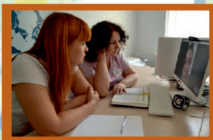
On-line консультация skype: centr-reab