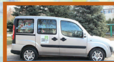
Социальное такси 48-31-77